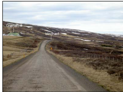
Mynd 4. Hæðin neðan Grænuhlíðar (SJ).

Vegurinn er malarvegur og er nokkur rykmengun í nágrenni hans.