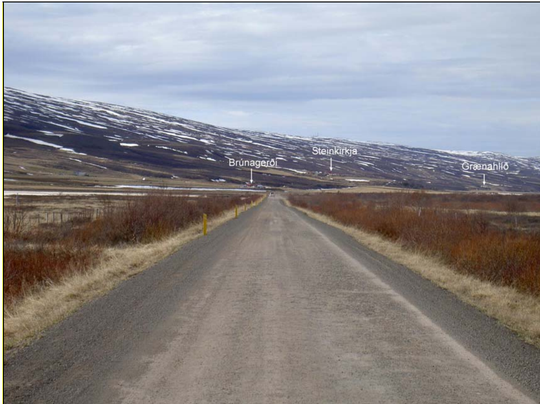
Mynd 2. Núverandi vegur sunnan Brúnagerðis (SJ).

Vegurinn er í vegtegund C2. Hann er á köflum lítið uppbyggður og uppfyllir ekki þær kröfur sem gerður eru til vegar af þeirri vegtegund.