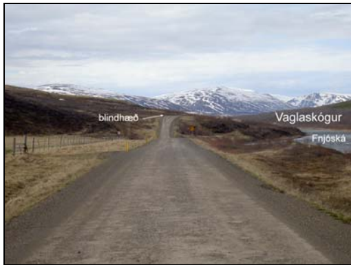
Mynd 3. Blindhæð skammt norðan slitlagsendi við Veturliðastaði (SJ).

Hæðarlega núverandi vegar er nokkuð góð, utan blindhæða við slitlagsenda norðan Veturliðastaða (Mynd 3) og neðan Grænuhlíðar (Mynd 4).