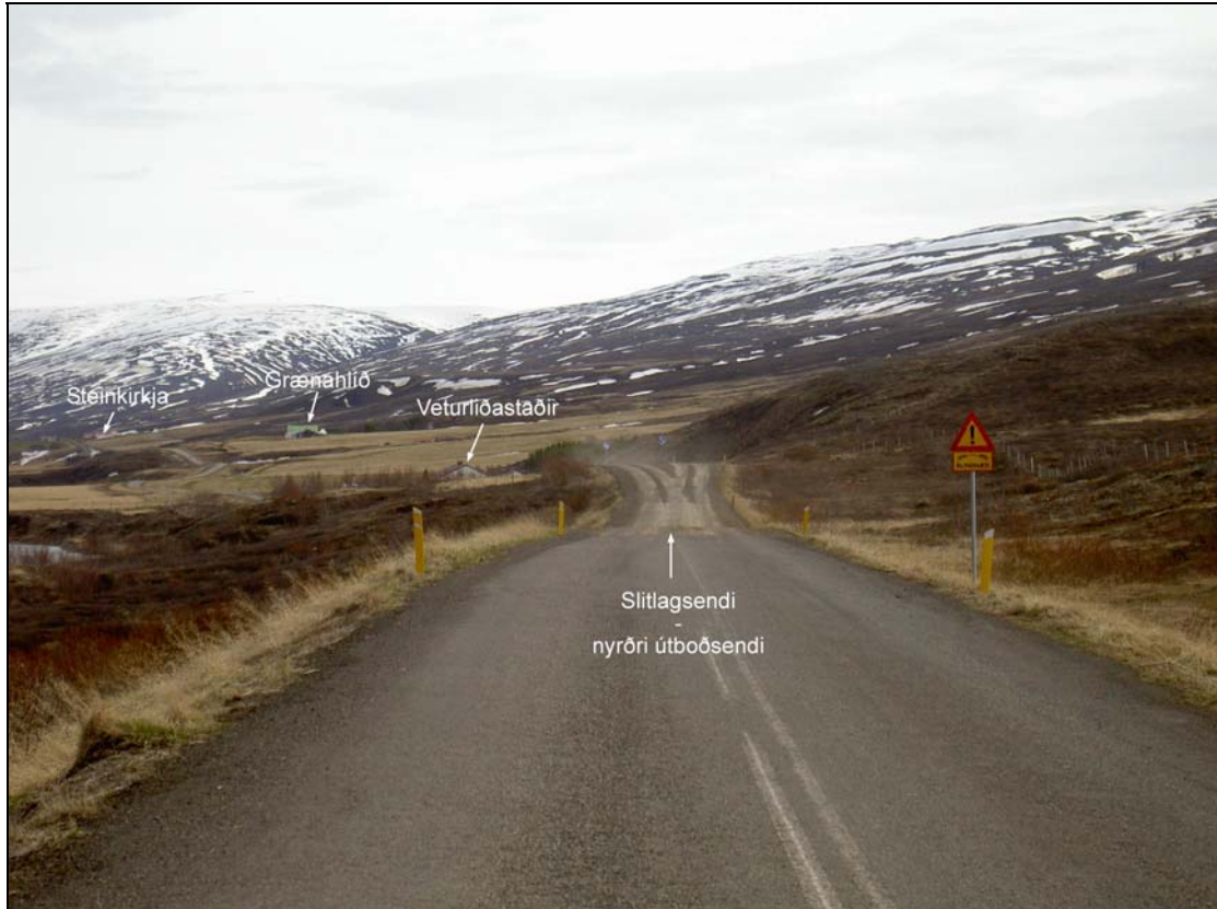
Mynd 1. Horft suður Fnjóskadal frá nyrðri útboðsenda (SJ).

Fyrirhugað framkvæmdasvæði er í sveitarfélaginu Þingeyjarsveit í Suður-Þingeyjarsýslu og liggur um lönd jarðanna Veturliðastaða/Grænuhlíðar, Steinkirkju, Brúnagerðis, Fjósatungu, Kotungsstaða (4 sumarhús) og Illugastaða (Mynd 1) (Teikning 1).