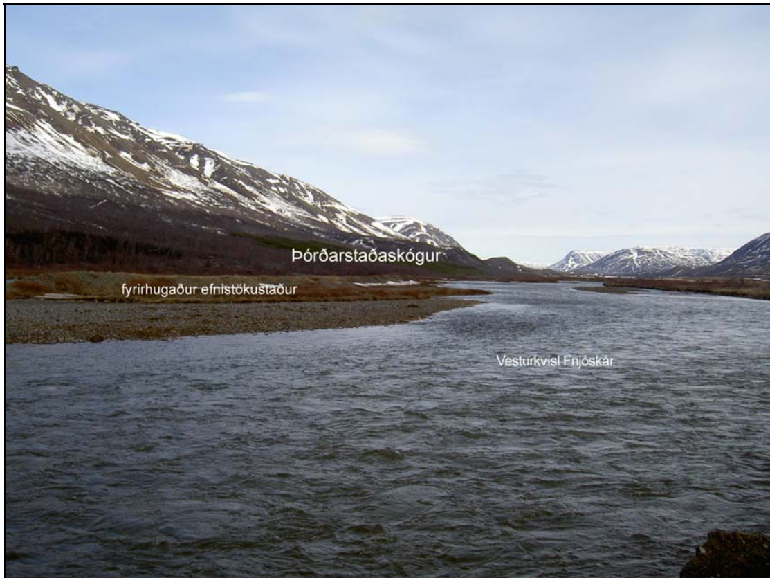
Mynd 5. Fyrirhugaður efnistökuastaður, horft til suðurs yfir áreyrar Fnjóskár (SJ).

Áætluð efnisþörf í verkið er um 70.700 m 3 . Efni í fyllingar, fláafleyga og hluta neðra burðarlags, samtals um 38.500 m 3 , er fyrirhugað að taka úr skeringum á vegsvæði. Annað efni þ.e. hluta neðra burðarlags, efra burðarlag og steinefni í klæðingar, samtals 32.000 m 3 , er fyrirhugað að taka úr garði á áreyrum Fnjóskár í landi Brúnagerðis, Fjósatungu og Þórðarstaða (Mynd 5).